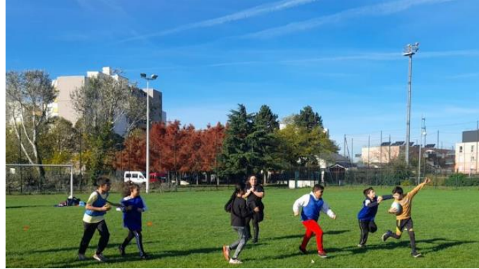
TREMBLAY EN FRANCE - RUGBY