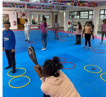
LA COURNEUVE – TAEKWONDO