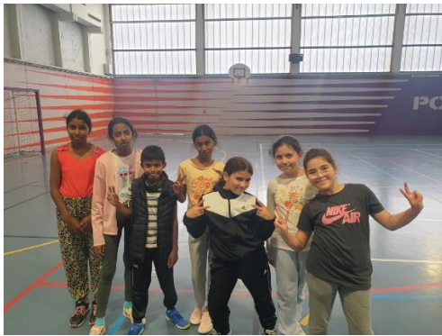
CLICHY-SOUS-BOIS – MULTISPORT