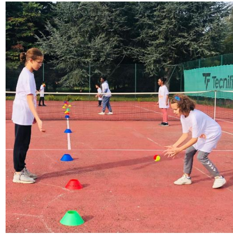
AULNAY-SOUS-BOIS - TENNIS