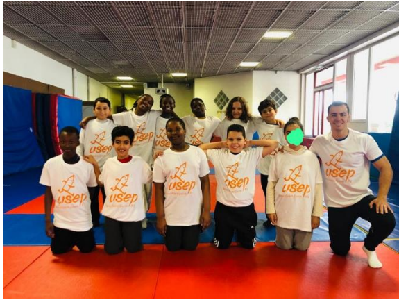
BONDY – LUTTE