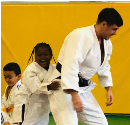
AULNAY-SOUS-BOIS – JUDO